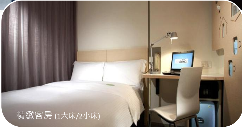
精緻客房 (1大床/2小床)